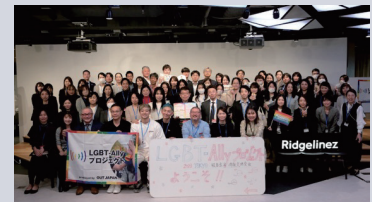
業界を超えた活動を推進