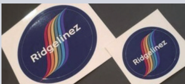
オリジナルAllyグッズ