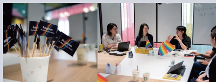
Allyコミュニティイベント