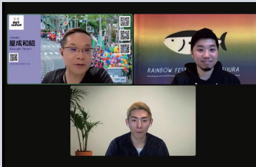
全従業員必須セクシャルマイノリティ研修

全従業員必須のセクシャルマイノリティ研修の実施や、Ally表明をする従業員に向けてオリジナルグッズを配布するなど、コミュニティの輪を広げる活動を行っています。